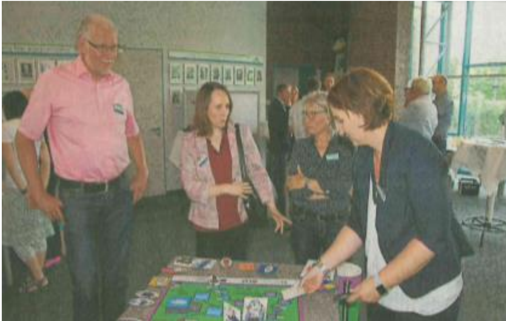
Austausch mit Unternehmern auf dem 6. Wirtschaftsforum der Wirtschaftsförderung Wadersloh / OWL